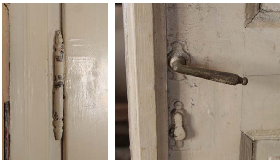
Originalno vratno okovje.

Bolje ohranjena vrata se ohrani in obnovi. Okovje vrat je bilo v večini zamenjano. Originalno okovje naj se ohrani in po potrebi obnovi, manjkajoče pa nadomesti z novim, historičnega izgleda. Tip novega stavbnega okovja je potrebno uskladiti z odgovornim konservatorjem.